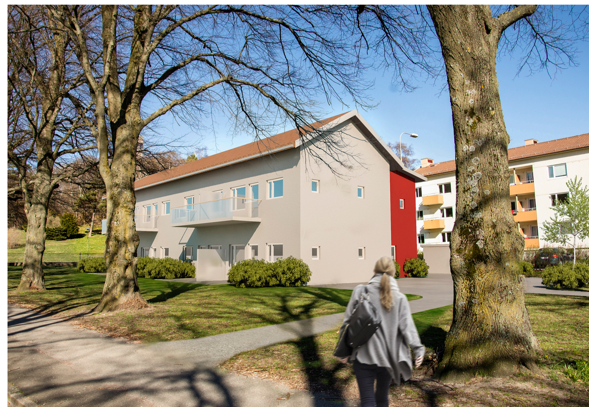
Fotomontage av bebyggelseförslag, Norconsult

Samrådet är ett skede där du som medborgare kan tycka till om förslaget. När samrådstiden är slut bearbetas dina synpunkter och ett färdigt detaljplaneförslag tas fram och ställs ut för granskning. Du måste lämna skriftliga synpunkter senast i granskningskedet annars kan du förlora rätten att överklaga beslut att anta detaljplanen.